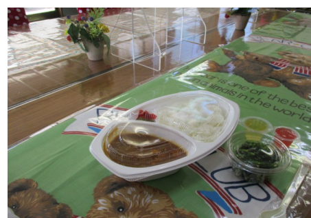
(テイクアウト用盛り付け)

4月の子ども食堂を終えて、「おいしかったです！」と大変うれしい声を皆さんから頂き、「もう少し頑張れそう？」と、5月からは100食をご提供させていただくことになりました。また、5月より入口の脇のスペースで、衣類等の提供も始めました。服を手に取りながら「家にもサイズアウトした服があるんです。今度持ってきていいですか？」とお互い様の輪が広がっていきそうな予感 「やぎさんのカレー」が皆さんの集いの場になるとよいなあ…と思っています。皆さん、「やぎさんのカレー」にどうぞ足を運んでくださいね。