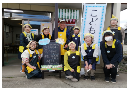
(スタッフが作ってくれたおそろいのエプロン、三角巾です。似合ってる?)