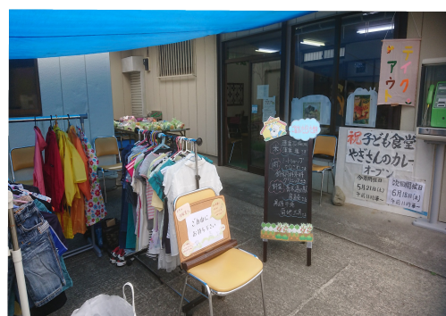
(季節の洋服や靴、おもちゃなど、皆さんから頂いたものを提供しています。)