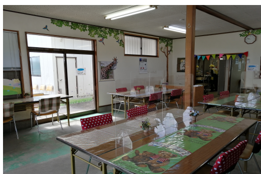
(椅子カバーやテーブルクロスなど手作りの飾りでお出迎え)