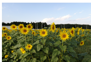
(10月19日撮影那須塩原市内ひまわり畑)